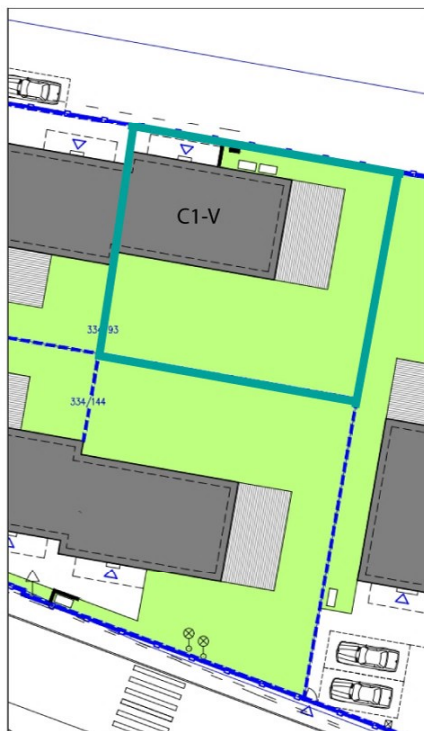
SITUAČNÍ PLÁN POZEMKU: