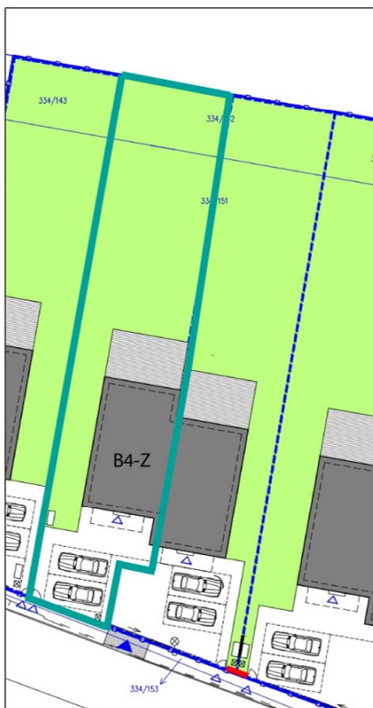
SITUAČNÍ PLÁN POZEMKU: