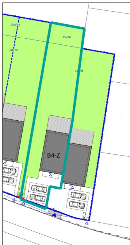
SITUAČNÍ PLÁN POZEMKU: